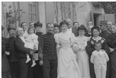
Ma recherche généalogique

> Retrouvez les étapes de la recherche dans la rubrique