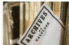
Ma recherche libre avec le moteur de recherche