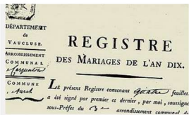
Registres paroissiaux et d'état civil

> POUR LES ACTES DE L'ÉTAT CIVIL D'AVIGNON, CONSULTEZ LE SITE DES ARCHIVES MUNICIPALES