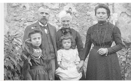
Recensements de la population - listes nominatives

> POUR LES ACTES DE L'ÉTAT CIVIL D'AVIGNON, CONSULTEZ LE SITE DES ARCHIVES MUNICIPALES