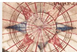
État des fonds

Retrouvez ici la version navigable des instruments de recherche : un état des fonds pour bénéficier d'un panorama complet des sources vauclusiennes, des guides de recherche thématiques et des inventaires pour une recherche facilitée. La liste est mise à jour régulièrement.