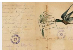
Catalogues et guides thématiques