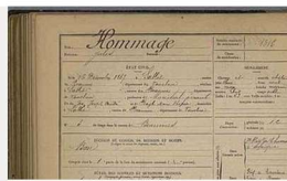
Registres matricules militaires

> VOIR AUSSI LA RECHERCHE NOMINATIVE DES CLASSES 1887 À 1921