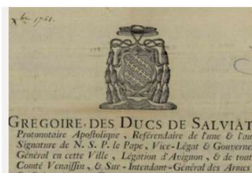
Archives des institutions supprimées sous l'Ancien Régime et à la Révolution